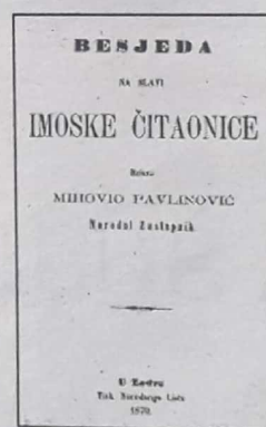
Naslovna stranica brošure u kojoj je tiskan Pavlinovićevo govore "Besjeda na slavi Imotske čitaonice".

Iz govora Mihovila Pavlinovića prenosimo manji izvadak: "Nek se bani po Zagrebu koga volja; al nek zna da, ko se tu preko hrvatskog prava zabani, da se zamalo i razbani."