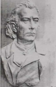
Ivan Rendić: Reljef sa likom Mihovila Pavlinovića, bronca (Split, Galerija umjetnina).

U Hrvatskoj su prve čitaonice osnovane sredinom XVIII. st. pod talijanskim ili njemačkim nazivima (Gabinetto di lettura, Casino, Casino Vercin itd.) U Zadru je čitaonica osnovana 1750. g. pod nazivom Casino nobile, potom u Šibeniku (1755.), Rijeci (1806.), u Splitu (1817.). U ovim čitaonica-