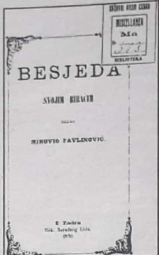
Naslovna stranica Pavlinovića govora biračima Imotske krajine 1870. g.